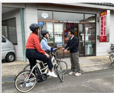
▲観光案内所でレンタサイクルもできます