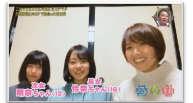
▲2022年別番組でリモート出演