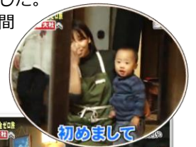
初めまして お金を持たずに旅をしております