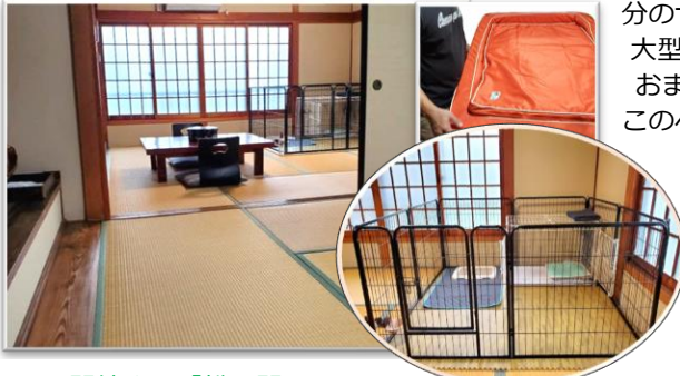
▲2間続きの「松の間」に ジョイントマットを敷いてベッド、トイレ、給水器、 給餌皿、サークルを準備