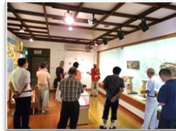
▲文化財保護委員・湯梨浜町観光ガイドの会長

◆羽合町歴史民俗資料館（湯梨浜町久留）を活用し、町の歴史を多くの皆さまに知っていただくため8月21日（日）をオープンデーとして、午後2回のスケジュールでお客様をお迎えしました。羽合歴史民俗資料館は、昭和59年10月に開館したもので、羽合地域の弥生時代・古墳時代の展示物を中心に、長瀬高浜遺跡や橋津古墳群など、古代史を考える上で大変貴重な資料が展示されています。埴輪の模様1本1本に1600年前の時代に生きた人々の息づかいを感じ、様々な資料から現世では誰も見たことのない“当時”を自分なりに想像し、思い描いて見ていくと、興味関心が深まるのです。