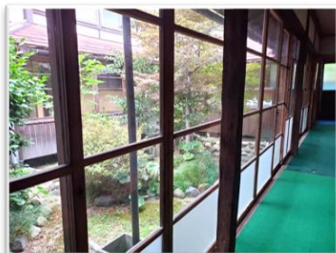
▲雰囲気のある廊下からは 縁側と中庭が見渡せます。 アイドルの写真集撮影の ワンショットにもなりました。

そこで、ブームに乗り町のシンボル東郷池(湖)の名もあって「東郷館」と命名されたということです。(・ω・)ムム