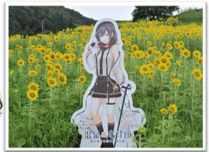
▲ひまわりと浮乃ちゃん