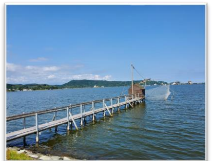
▲四ツ手網/東郷湖に伝わる独特の仕掛け網でエビやコブナなどを捕る漁法。現在は観光用に残されています。