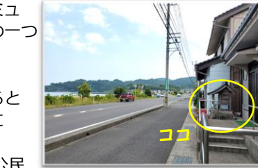
▲県道 22 号線沿い 松崎五区公民館前のオオカメさん 例祭は毎年 5 月 3 日です

それも 120 年以上もの間、毎日続いているというから驚きです。松崎は、かつて水陸両方の交通の要衝であり宿場町として商業も栄えた場所としても知られていますが、「天保 15 年 (1844) 松崎町分田畑全図」や「明治 5 年松崎宿田畑地続字限絵図」でも分かるように、南北に長い街並みが連なっており、火災が起こった時には大火事に見舞われることが幾度もあったようです。このような経験から住民の間で“水の神をお祀りする習慣”ができました。