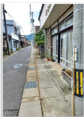
▲松崎五区内、道路の両端には船上神社太玉串

以前の松崎五区公民館前に移され、さらに平成 12 年 現在の松崎五区公民館前に移されたということです。幕末から近代にかけて疫病除けの神としての「船上さん」は多く勧請されたようですが、時代と共に廃れてしまった船上さん、オオカメさんもあります。これからも地域住民が安心して暮らすための守り神として、いつまでも続け残していきたい松崎のオオカメさん信仰です。