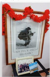
▲フラの原形である写真 ▲ハワイの国旗

今後も、ハワイ郡との繋がりを大切に守り育てながら、その時代に合った新たな取り組みも考えていきたいと思っています。研修内容に興味をお持ちの方がいましたら資料等をお渡しいたしますのでどうぞお気軽に湯梨浜町観光協会