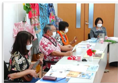
▲ウクレレ演奏する二人