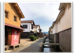
▲A・B・Cコース/ 倉吉市白壁土蔵群