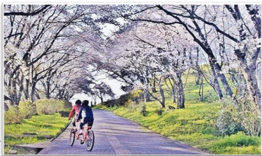
▲さくら工芸品工房の桜坂を駆け上がるお二人

気持ちが沈みがちな今、すがすがしい空気を胸いっぱい吸い込んで、ウォーキング・花めぐり・足湯めぐり・温泉めぐりなどそれぞれの楽しみ方でゆったりと東郷湖の風景を楽しんでみませんか。