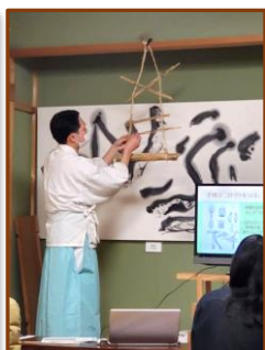
▲柿の木に掛けるコトツトは3年連なると家が繁栄するとか(˘o˘)/

カヤの箸を使って残しておいた食べ物と神棚の食べ物を少しずつ「ツト」の中に入れ、神棚の箸が一番上にクロスして、家族の箸ははしご型に取り付けます。