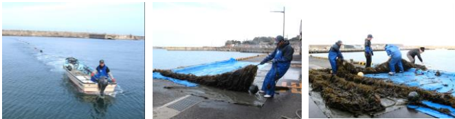
入り江の先からワカメのロープを小船で運びます。

◆2月18日(月)湯梨浜町泊 荷捌き所前にて地元泊小学校3年生による「ワカメの収穫体験」が行われました。この養殖ワカメは、昨年12月13日に児童が種付けたもので、浮き玉をつけて水深を保った海の中のロープ(種付けたもの)は、わずか2ヶ月の間に水温・光・海水の流れや栄養のある泊の海ですくすくと成長していました。