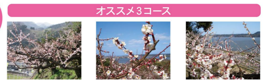
梅林と山が水墨画のような [棚霞梅林]