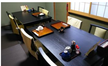
大宴会場 (グループごとにお食事) 小宴会場 (個室)